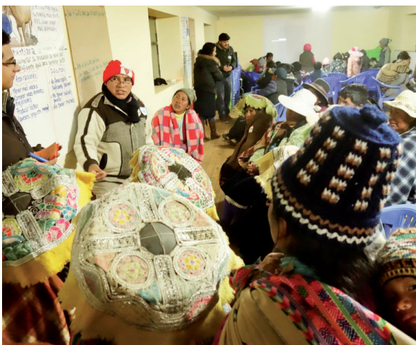
Foto 1: Taller de devolución de la fase de escucha a las comunidades (Quispicanchi, Cusco, 2018).

Según Mimi Cuq, responsable del programa Work4Progress en Perú: "La implementación de un programa como Work4Progress propone una nueva metodología, una mirada más atenta y abierta a la complejidad de la realidad, y nos desafía también a proponer nuevas ideas, a arriesgar, a atreverse para mejorar, mejorar nuestra comprensión de la realidad, mejorar nuestras capacidades de trabajar con otros, mejorar los resultados de nuestras intervenciones para contribuir a la mejora de la calidad de vida de la población."